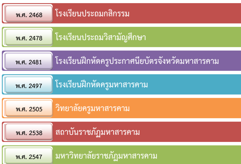
แผนภูมิที่ 1.1 พัฒนาการของมหาวิทยาลัยราชภัฏมหาสารคาม

มหาวิทยาลัยราชภัฏมหาสารคามมีประวัติการก่อตั้งมายาวนานตั้งแต่ปี พ.ศ. 2468 ได้พัฒนาจากโรงเรียนประถมกสิกรรม โรงเรียนประถมวิสามัญศึกษา โรงเรียนฝึกหัดครูประกาศนียบัตรจังหวัดมหาสารคาม โรงเรียนฝึกหัดครูมหาสารคาม วิทยาลัยครูมหาสารคาม สถาบันราชภัฏมหาสารคาม และมหาวิทยาลัยราชภัฏมหาสารคามตามลำดับ ดังแผนภูมิที่ 1.1